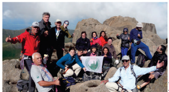
O grupo no cume das Agulhas Negras