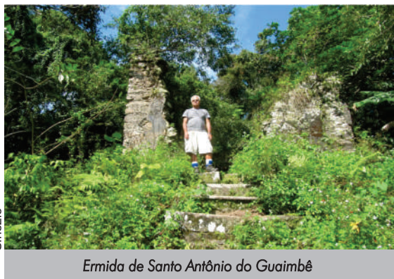
Ermida de Santo Antônio do Guaimbê

Se, logo no início daquele caminho calçado, você pegar um caminho de terra à esquerda, encontrará algumas relíquias arqueológicas. As primeiras são as ruínas da Ermida de Santo