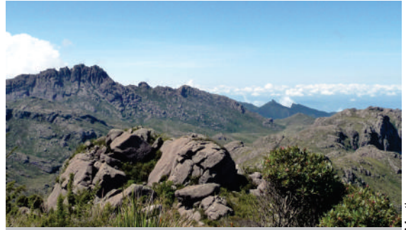
Entre o Morro do Couto e Prateleiras

todas as montanhas do Parque, com destaque para as Agulhas e as Prateleiras, e sobre as curvas da Serra Fina, semivestidas (ou, se preferirem, semidespidas) pelas nuvens. O nosso grupo levou duas horas e meia para fazer o trajeto do Couto até