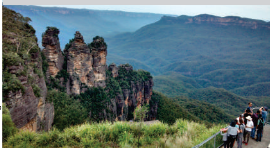
The Three Sisters (Blue Mountains)